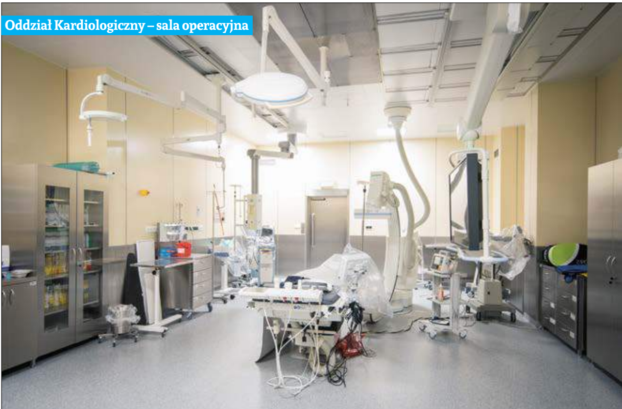
Oddział Kardiologiczny – sala operacyjna