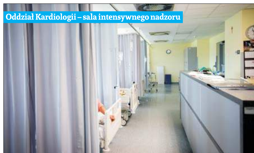
Oddział Kardiologii – sala intensywnego nadzoru