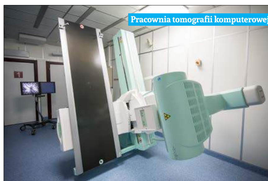
Pracownia tomografii komputerowej